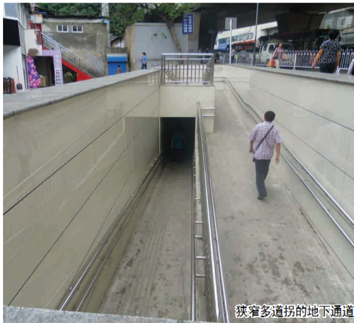
狭窄多道拐的地下通道

为了给市民提出的“如此狭长的地下通道方便谁?”一个回答,记者联系到贵阳市市政工程管理处,相关负责人表示,油榨街地下通道如此狭长是由地形所决定的,在设计时不只是一要考虑它的美观,更注重的是通道的安全性,所以希望市民们能体谅。